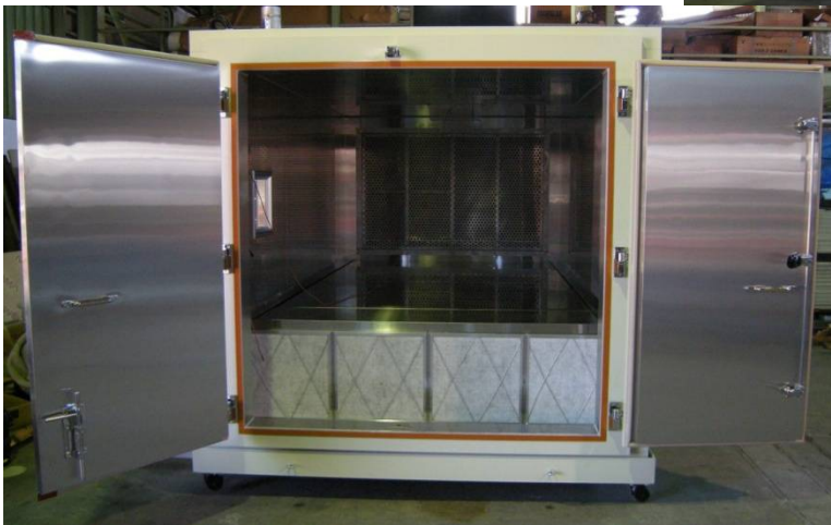
防爆型可変恒温恒湿槽